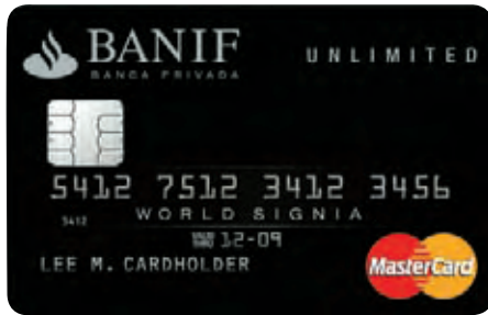
Tarjeta Banif, Unlimited, lanzada recientemente dentro de la red de Mastercard

La compañía de medios de pago ha lanzado recientemente un nuevo producto en colaboración con Banif: la tarjeta Banif Unlimited, dirigida a los clientes de mayor patrimonio de la división de banca privada del grupo Santander. Esta tarjeta incluye un seguro médico de cobertura en el extranjero de hasta 7,5 millones de euros, un seguro de responsabilidad civil en viajes de hasta 1,5 millones y acceso a las salas vip de los aeropuertos, entre otros servicios. Mastercard ha creado también junto con Banc Sabadell dos tarjetas para pymes y autónomos, denominadas Empresa y Corporate, y una tarjeta de prepago pensada especialmente para hacer regalos, que emitirá Caja Canarias.