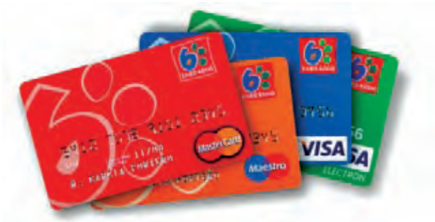
Tarjetas de la red Euro6000

Euro6000, red que da servicio a 37 cajas, registró 926 millones de operaciones con sus tarjetas entre marzo de 2008 y marzo de 2009; el importe de estos movimientos ascendió a 63.000 millones de euros. A finales del año pasado esta red tenía 15,1 millones de tarjetas en circulación, de las que seis millones eran Maestro -la marca de débito de Mastercard-, 5,5 millones Mastercard, 2,4 millones Visa Electrón -de débito- y 786.000 Visa, más 325.000 de otras marcas. Con ellas se realizaron 604 millones de operaciones en comercios -teniendo en cuenta tanto las compras como el uso de los datáfonos propios con tarjetas de otras redes-, y 322 millones de movimientos en cajeros automáticos. Aunque el número de operaciones se mantuvo estable durante el primer trimestre, la red ha notado un descenso del importe medio de las operaciones, así como de las retiradas de efectivo, y sobre todo una caída de las operaciones de productos más caros y menos recurrentes.