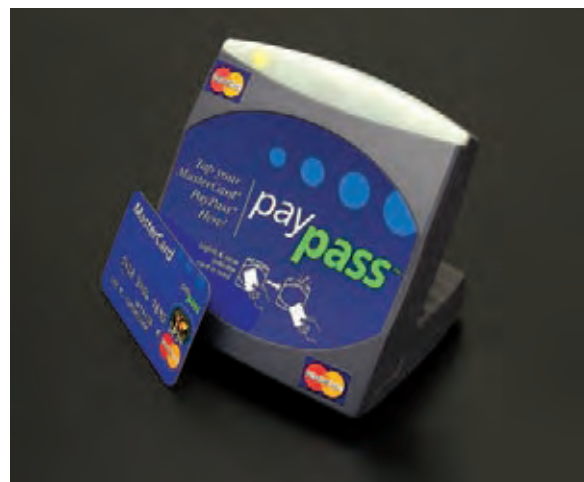
Sistema de pago sin contacto de Mastercard

La marca estadounidense está apostando fuerte por una tecnología de pago sin contacto denominada Paypass que ya tiene en funcionamiento en algunos países, como Polonia o Turquía, y que quiere extender a toda Europa; este sistema permite abonar pequeñas compras -de hasta 20 euros- sin tener que pasar la tarjeta o el objeto que utilicemos como emisor por ningún lector; aquél -que puede ser un reloj, o un bolígrafo, por ejemplo- emite una señal que es leída a distancia por un receptor, el cual carga el importe de la compra en nuestra cuenta. La empresa quiere extender esta tecnología, que ya se usa en los sistemas de transporte urbano de grandes ciudades como Hong-Kong, Tokio o Washington, a las pequeñas compras cotidianas, para que la falta de "calderilla" no sea un problema a la hora de realizarlas.